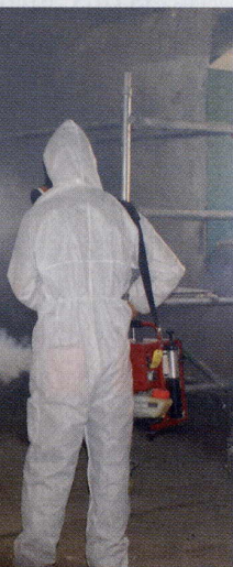
Pēc ugunsgrēka Sūtņu zāli dezinficēja.